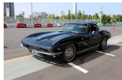
GM シボレー コルベット ステイングレイ(アメリカ)