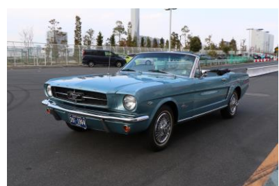
フォード マスタング コンバーチブル(アメリカ)